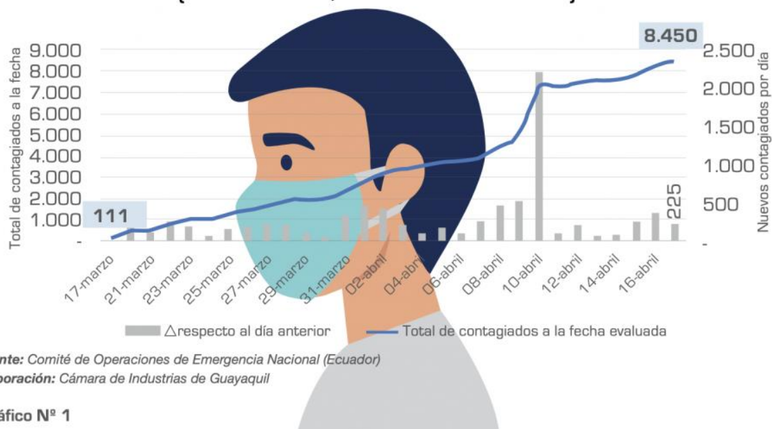
Gráfico N° 1